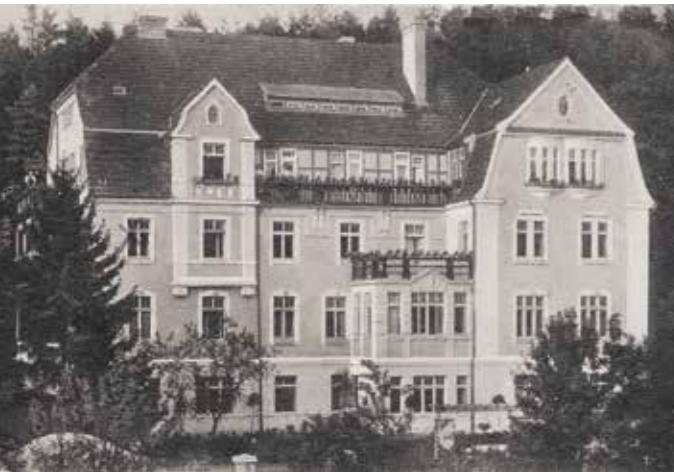
Erster Sitz des ‚Entjudungsinstituts‘, Bornstraße 11

14.45 - 15.45 Völkische Weltanschauung, Religiosität, Religionskonzepte und Religionsgemeinschaften in der langen Jahrhundertwende Uwe Puschner (Berlin)